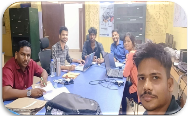
Our Management team Staffs at Adventure temporary office at Govt. ITI, Bhubaneswar.