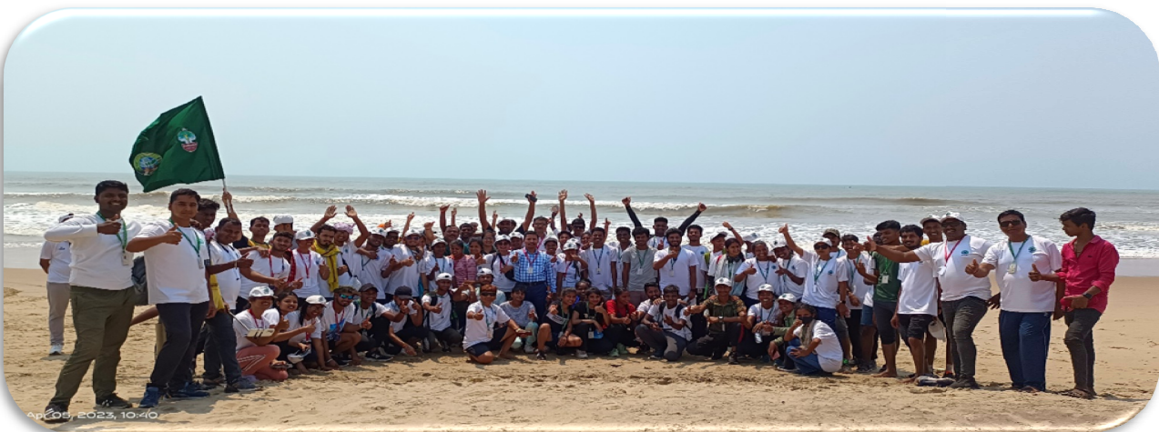
Coastal Trekking at Sea Beach, Puri