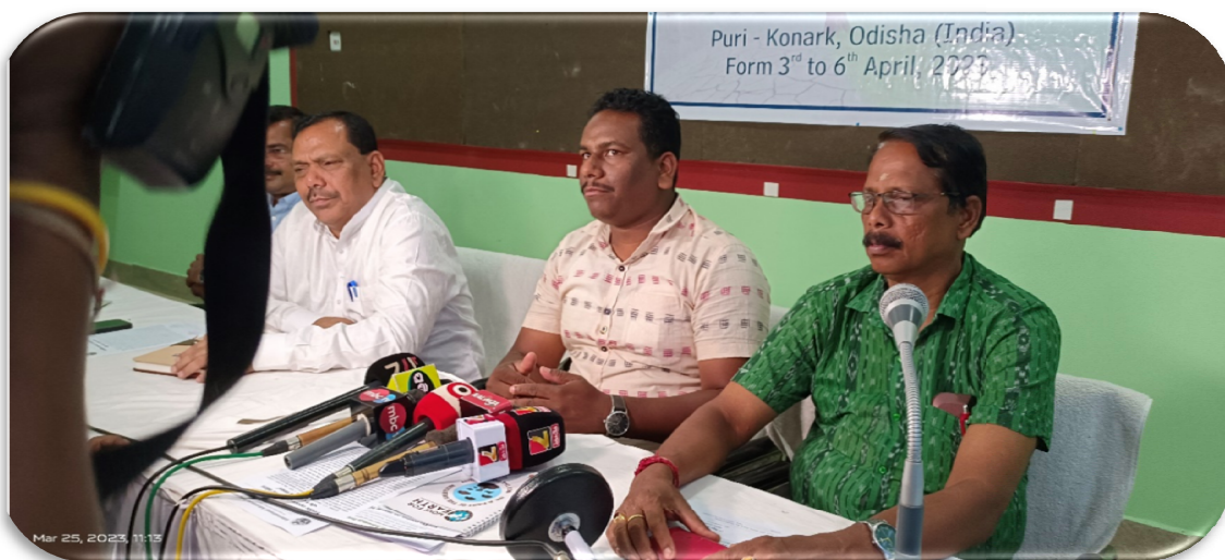
Press Meet at Youth Hostel, Puri