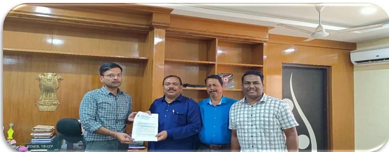
Meeting Collector & DM, Puri regarding the Camp.