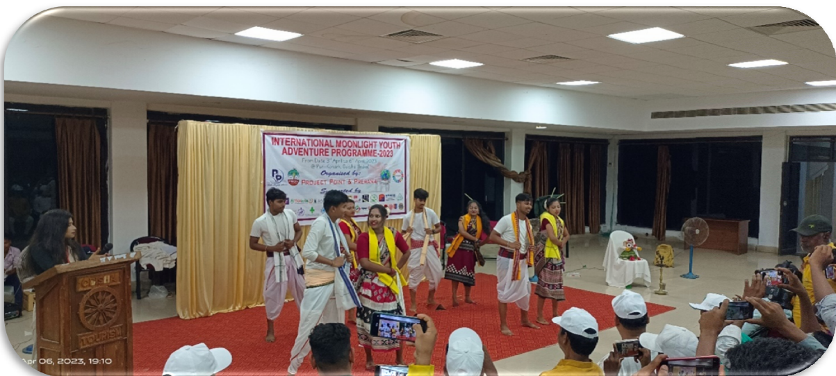
Closing Ceremony at Yatri Niwas, Konark.