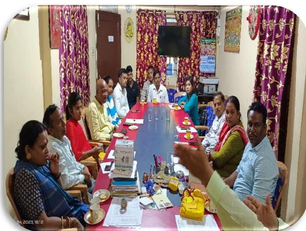
Preparatory meeting with all partners at OSBSG, Bhubaneswar.