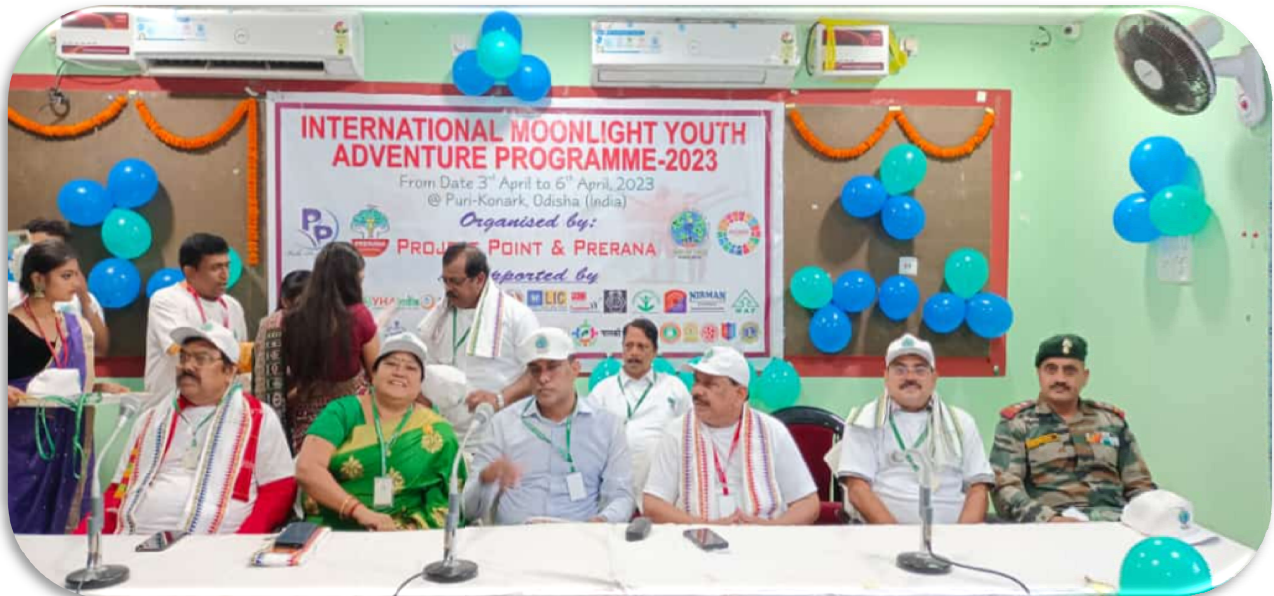
Inaugural Ceremony at Youth Hostel, Puri