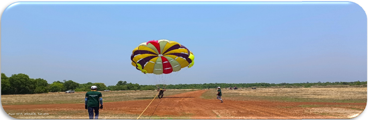
Para Selling Activities at Konark.