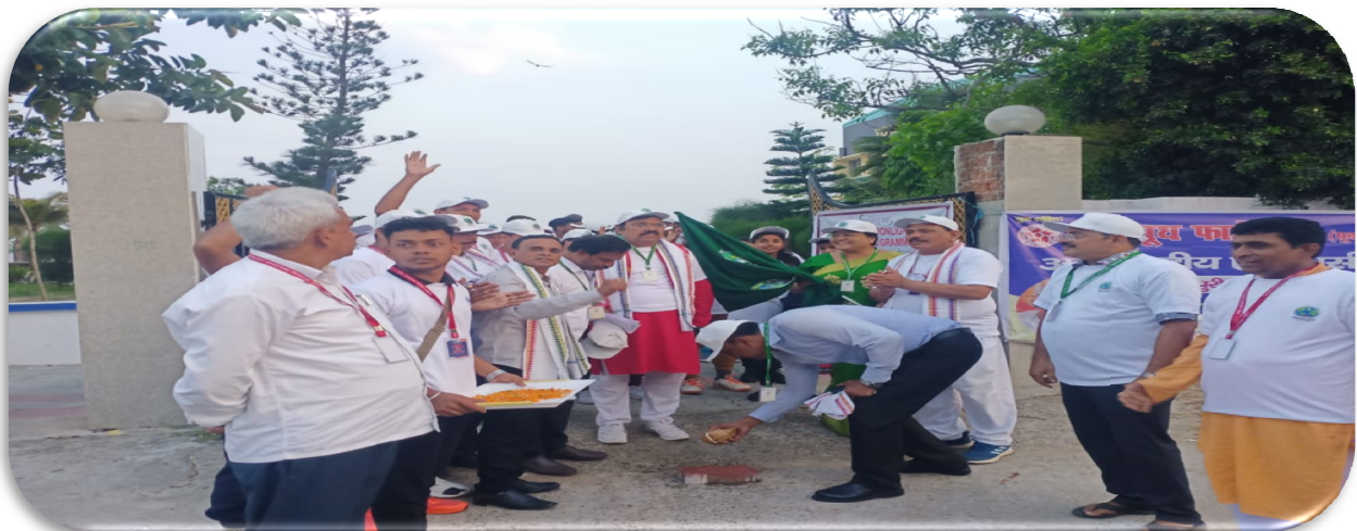
Trekking Started time from Youth Hostel to Konark.