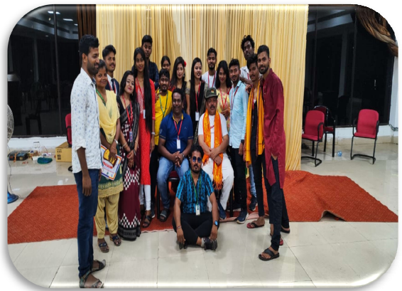
Campfire at KalyanMandap, NAC, Konark.